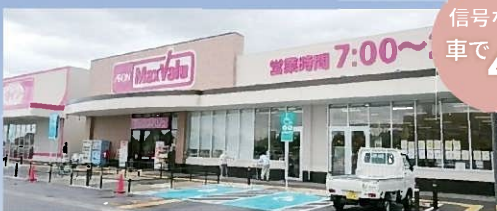
マックスバリュ黒部コラーレ前店 (約1,000m)